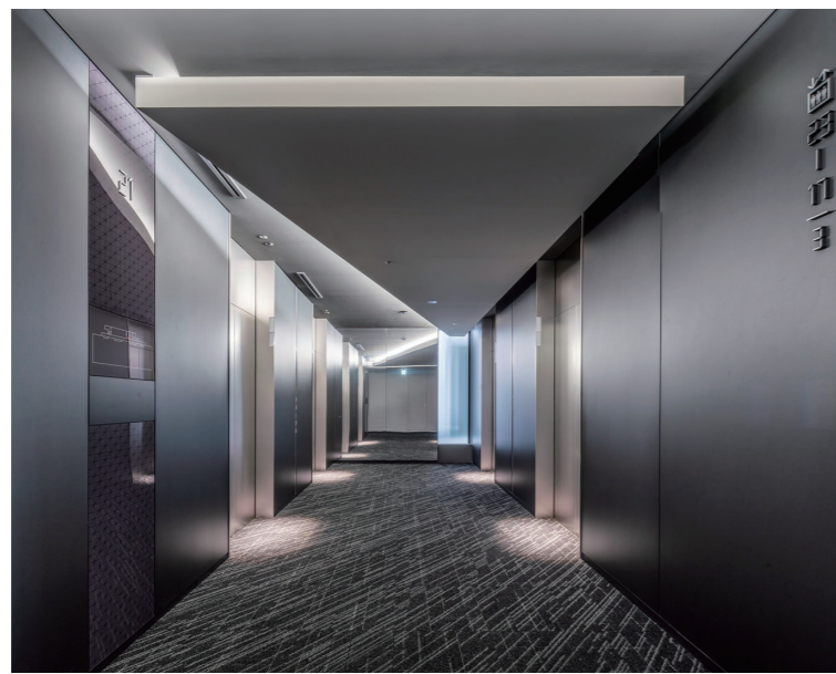
オフィスエレベーターホール