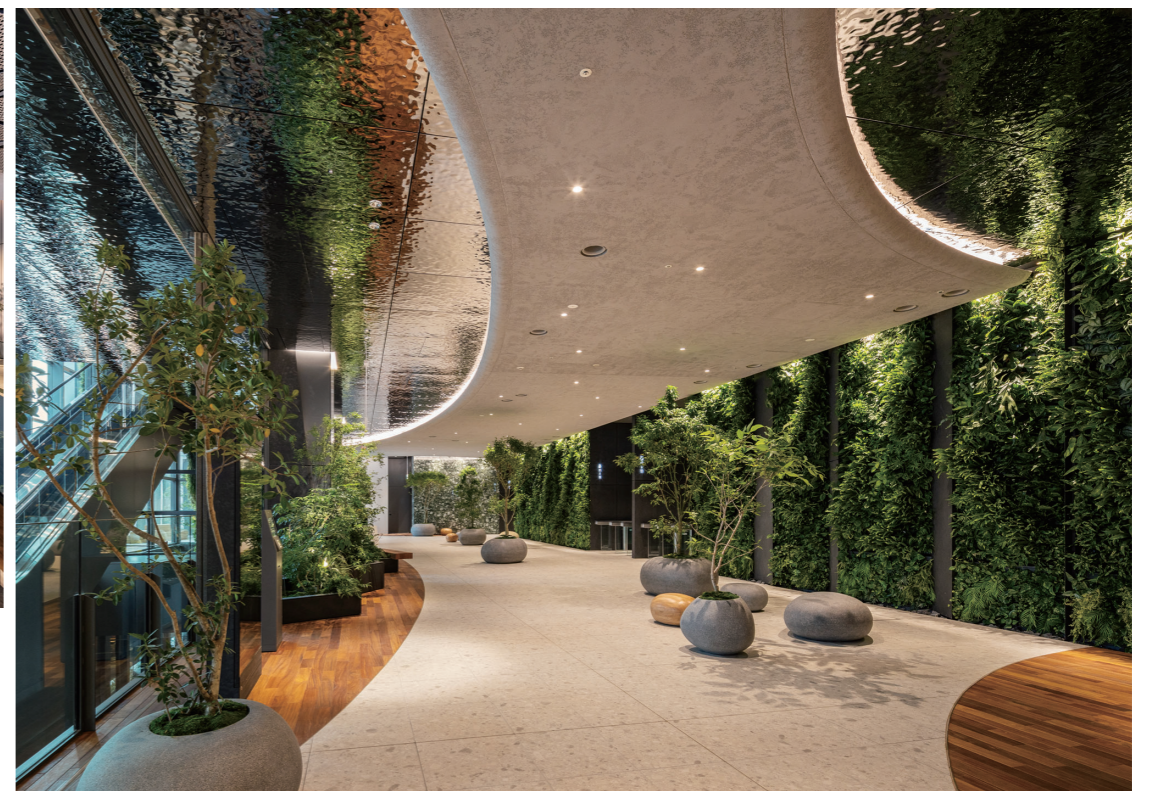
3階 オフィスエントランス