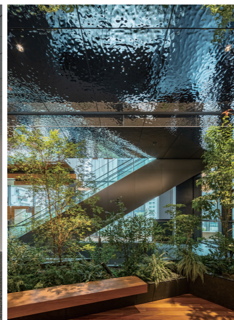
3階 オフィスエントランス