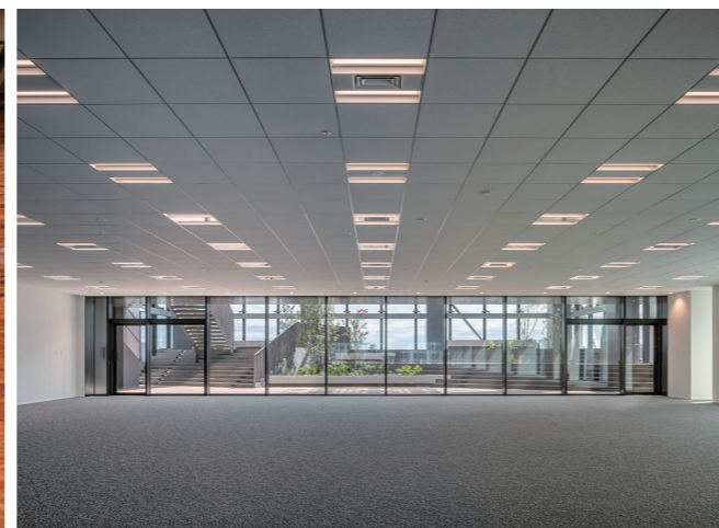
23階 オフィスフロア