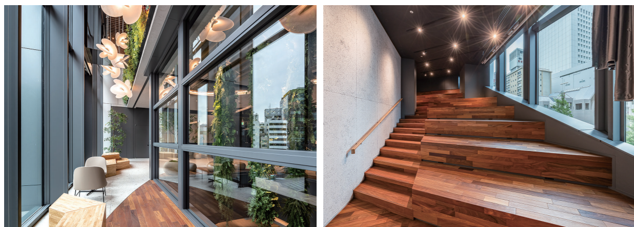
3階 青山通り側の環境