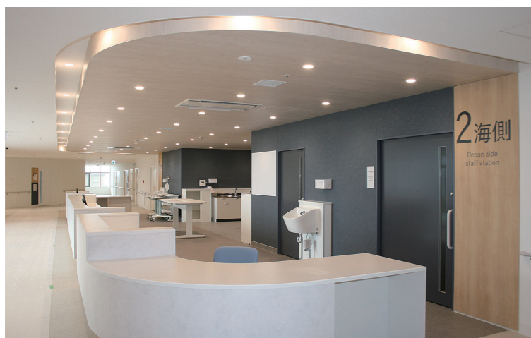
スタッフステーション