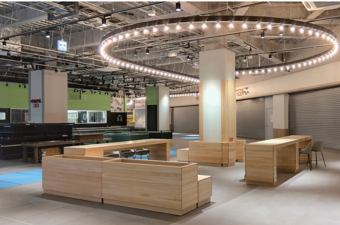
フードステーション③