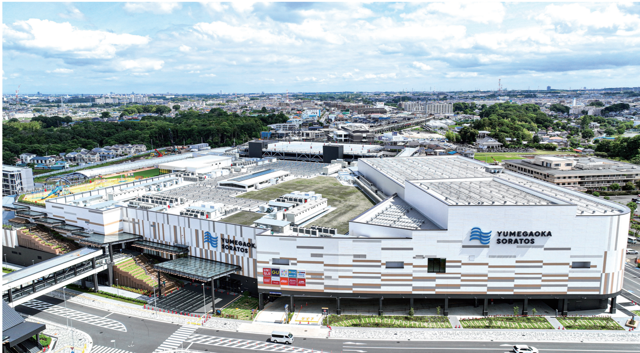
設計監理/福田組 施工/福田組・第一建設工業JV