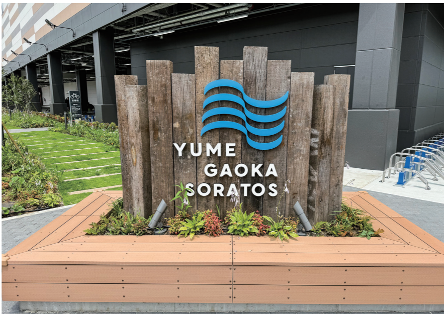
外観のロゴマーク