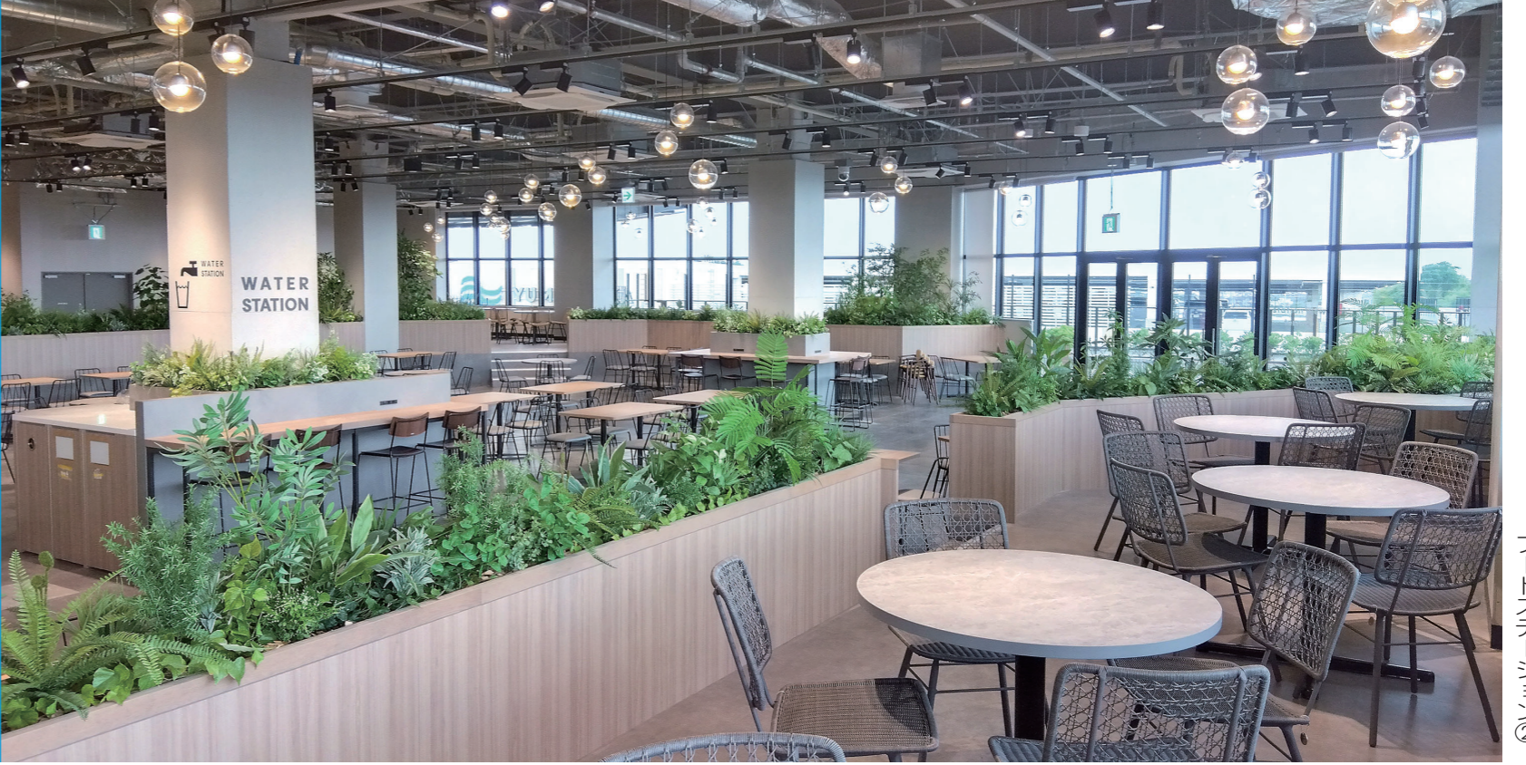
フードステーション②