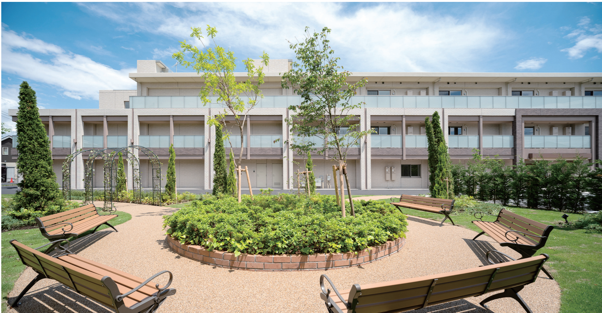
設計・監理/井上穰建築デザイン研究所 施工/鉄建建設