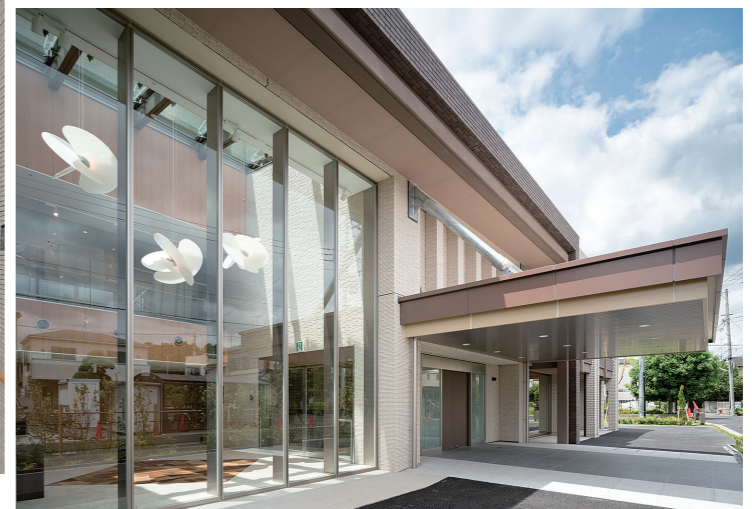
メインアプローチ