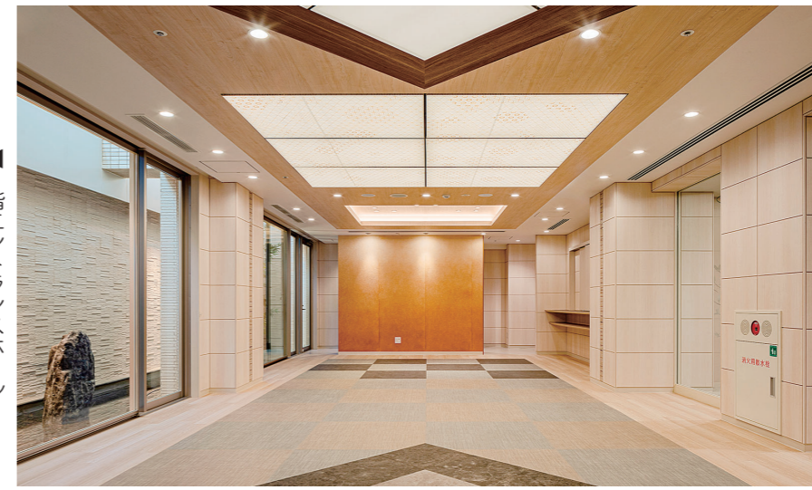
地下1階ダイニング