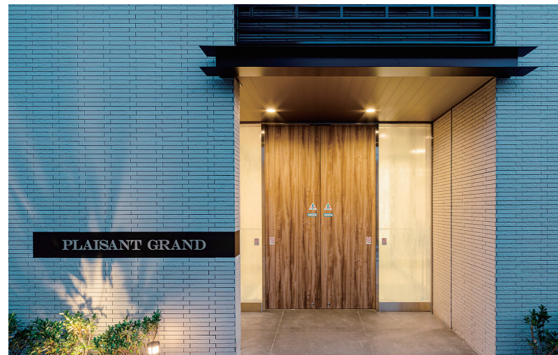
エントランス回り夜景