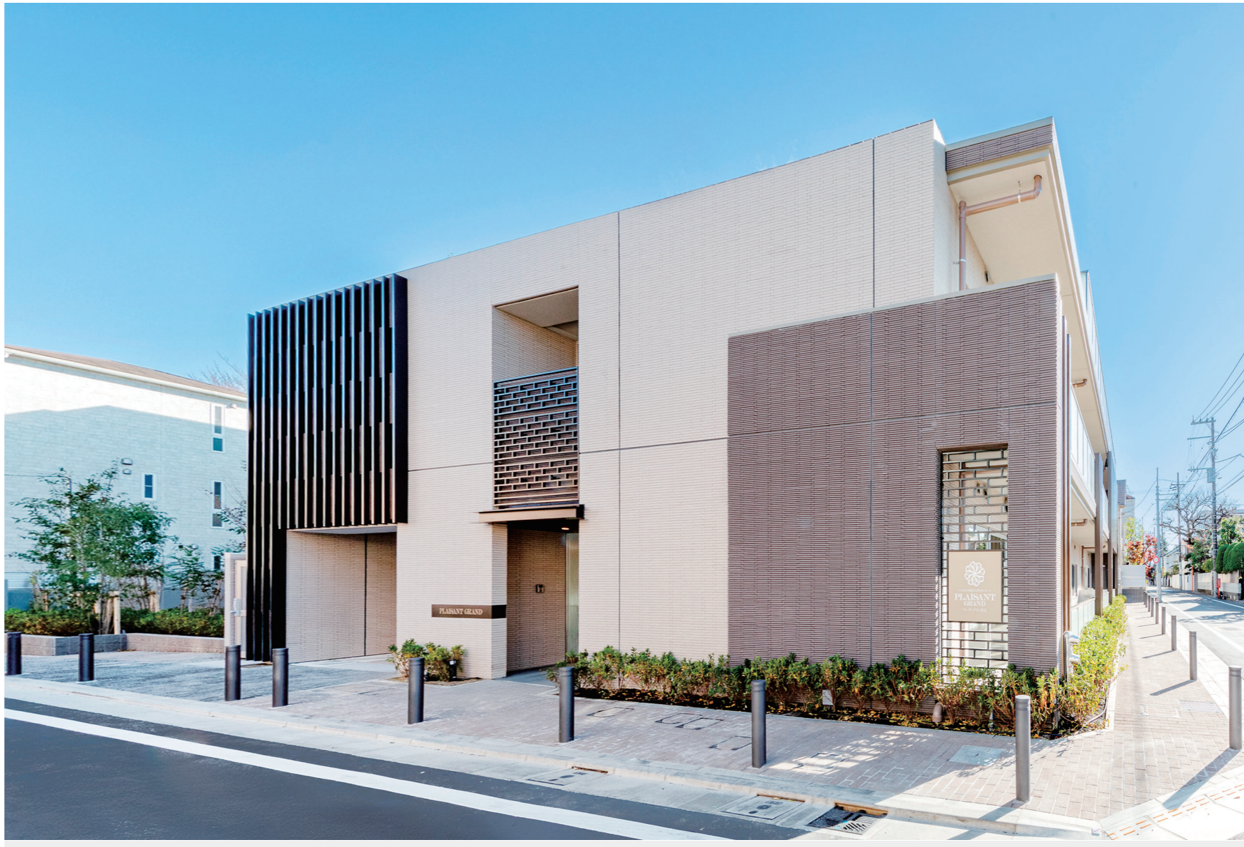
設計・監理／井上穰建築デザイン研究所 施工／鉄建建設

前回は続き、施設の設計を井上穰建築デザイン研究所様、施工を鉄建建設様に担当いただきました。制約のある敷地の中で地域と調和した施設づくりに取り組んでいただいたことに感謝申し上げます。