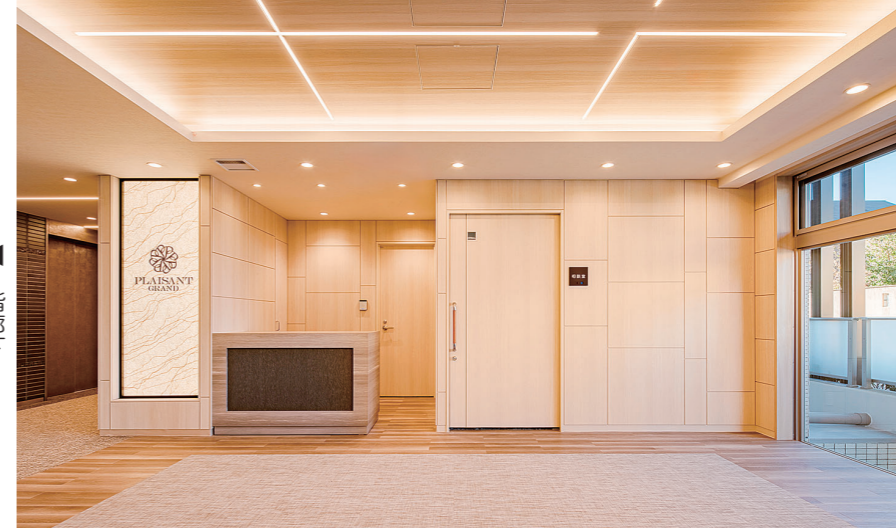
1階エントランスホール