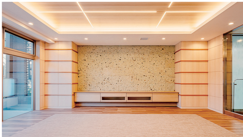
1階エントランスホール