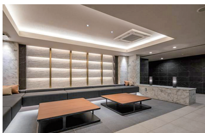
エントランスホール・ラウンジ