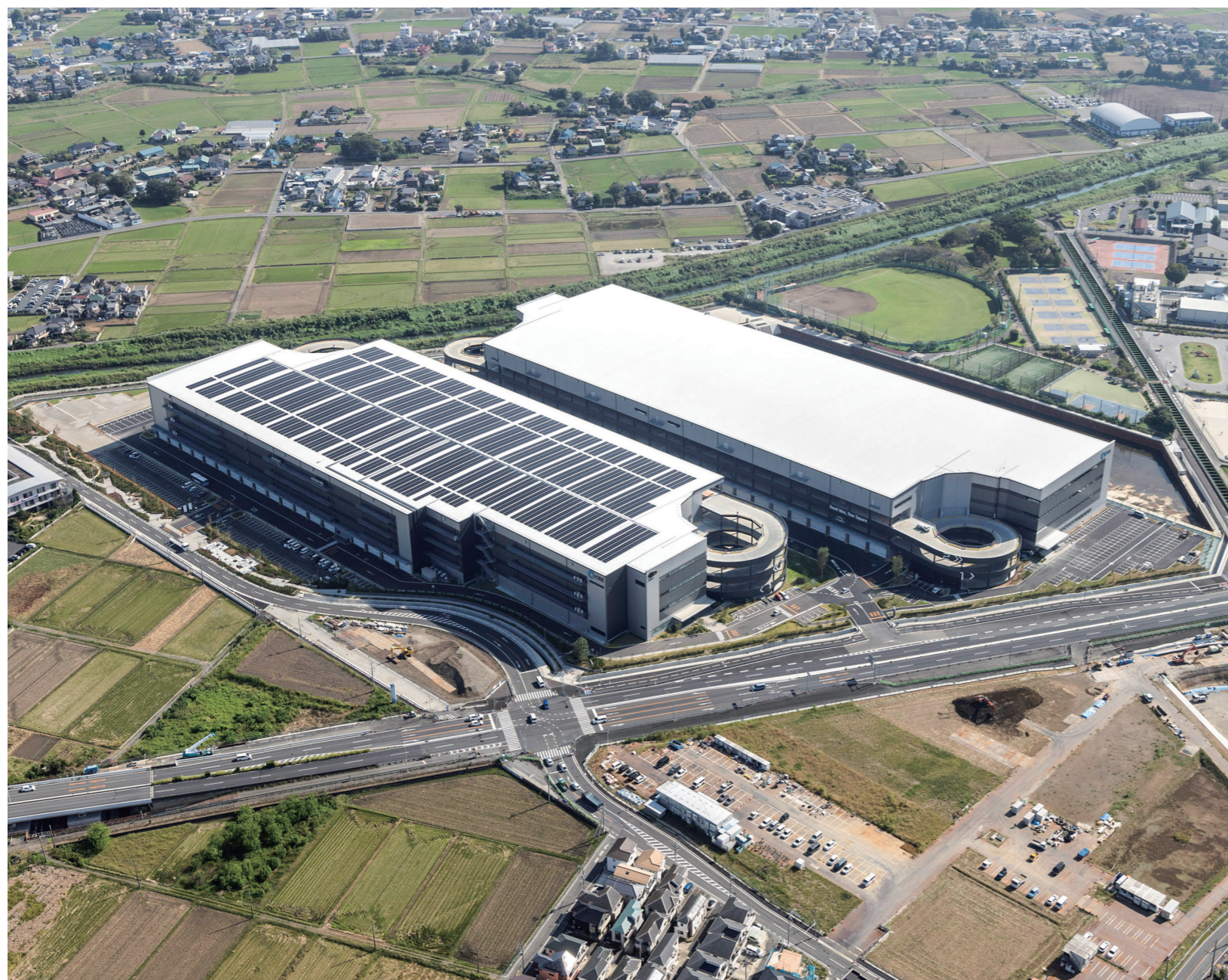
手前が「ロジスクエアふじみ野A」、奥側は「ロジスクエアふじみ野B」