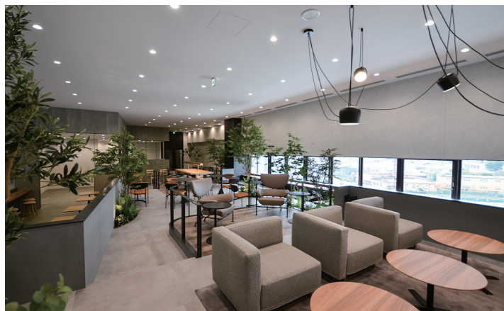
4階西カフェテリア