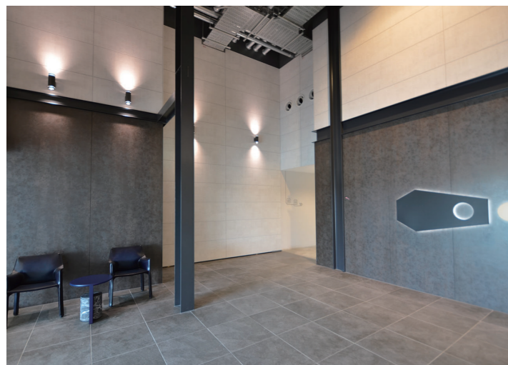
西エントランスホール