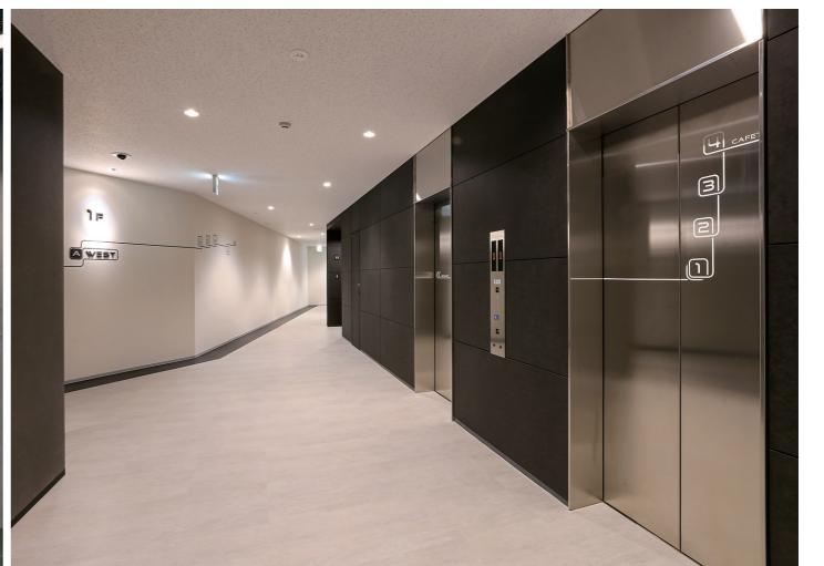
1階エレベーターホール