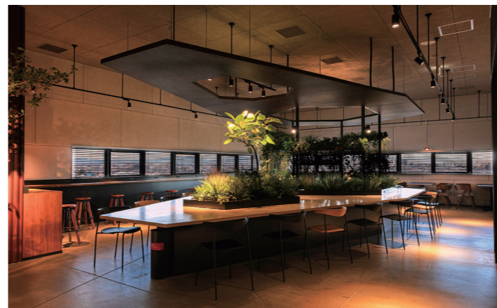
4階西カフェテリア