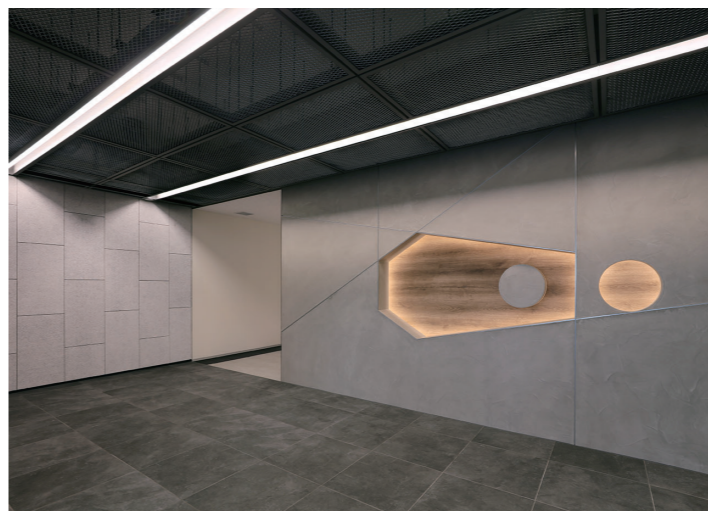
東エントランスホール