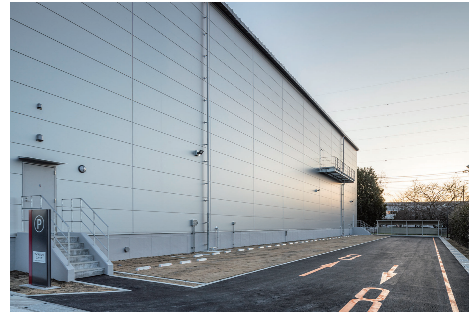
北側駐車場、駐輪場

理を行いました。環境対策では、分別回収による産業廃棄物の排出抑制に加え、場外排水のPH管理などを徹底させました。懸案であった工事中の事務所設置や駐車場に利用するための土地を近隣にお借りすることができ、敷地内のスペース確保という課題の解決につながりました。近隣対応を含めて職員一丸で安全、品質、工程を管理しながら、大きな問題もなく竣工を迎えることができました。皆さまの協力に感謝申し上げます。前田建設工業株式会社 関東支店 所長 横山智