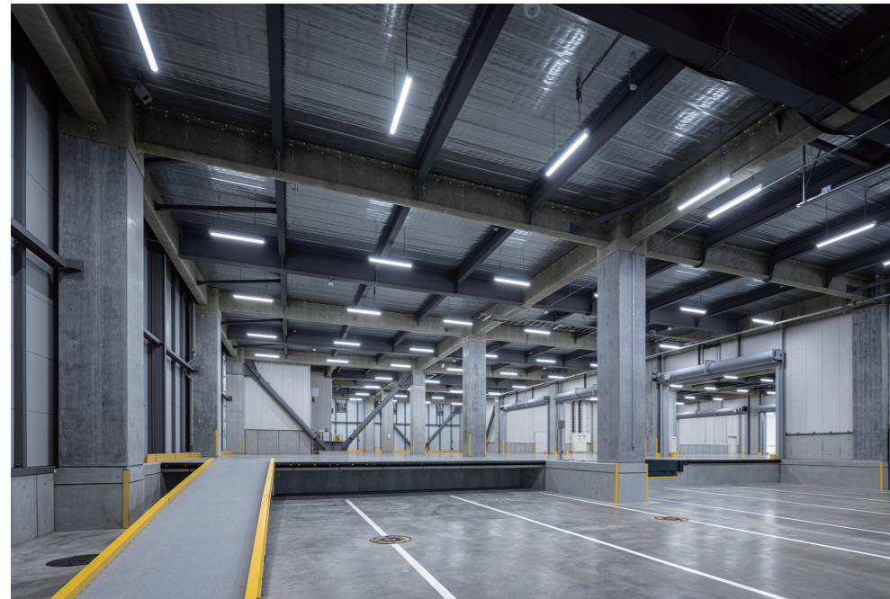
1階トラックバース