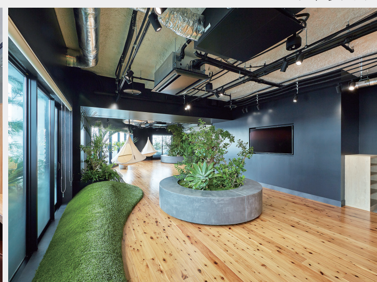
5階フォレストパーク