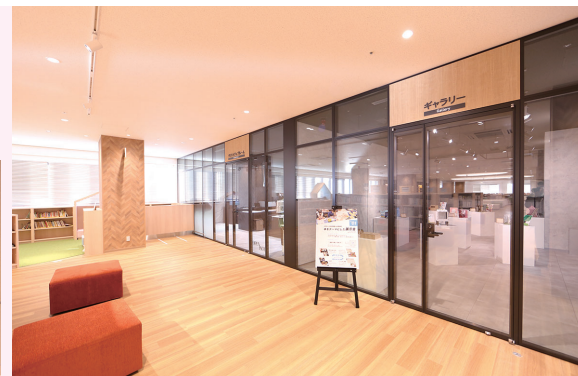
3階ギャラリー・クリエイティブルーム