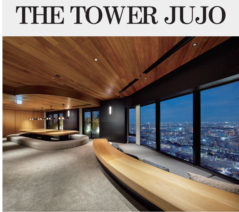
37階スカイラウンジ