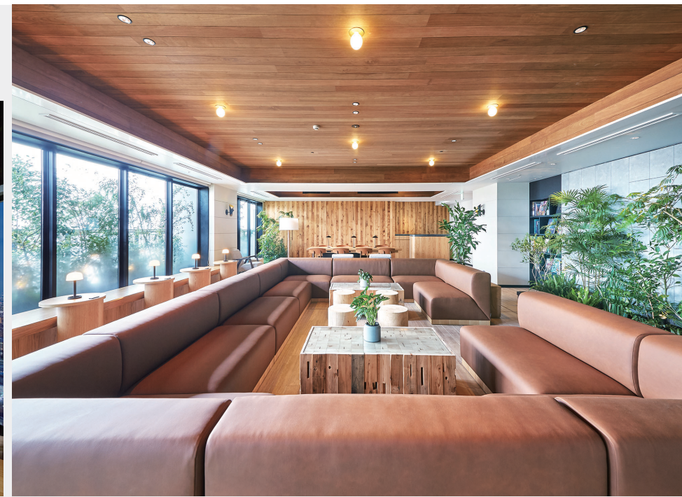
5階ウェルカムラウンジ