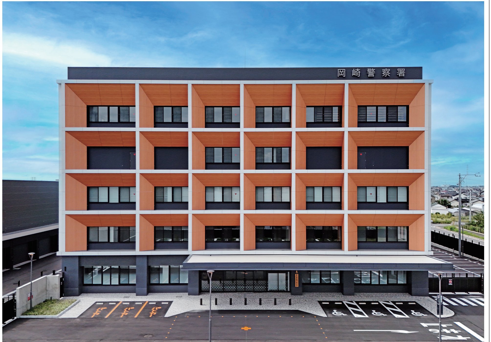
設計・監理/株久米設計 施工(建築)/熊谷・ヒメノビルドJV