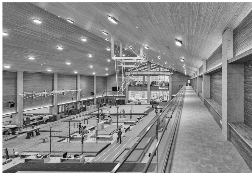
体操場とギャラリー