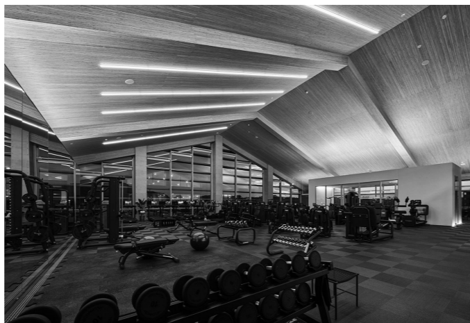
フィットネスクラブ