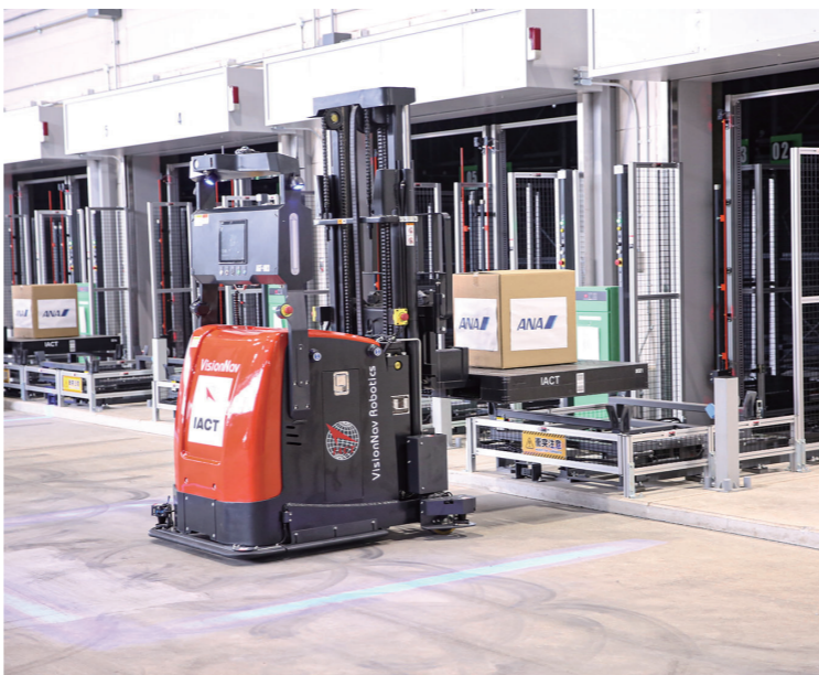
自動ラックからの積み出し