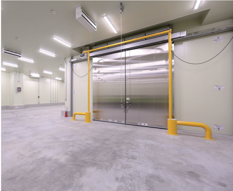
医薬品などに対応する温度管理施設