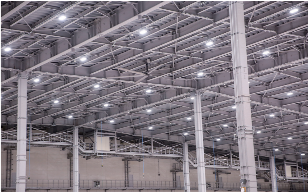
夏場の温度上昇を緩和するダブルスキンの折板屋根