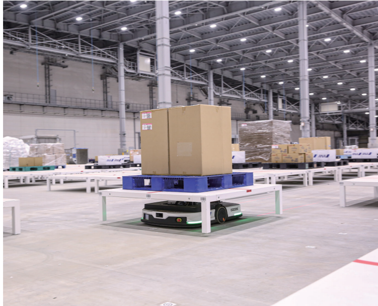
ロボットで貨物を移動