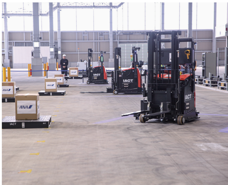
無人フォークリフトによる自動ラックへの入庫