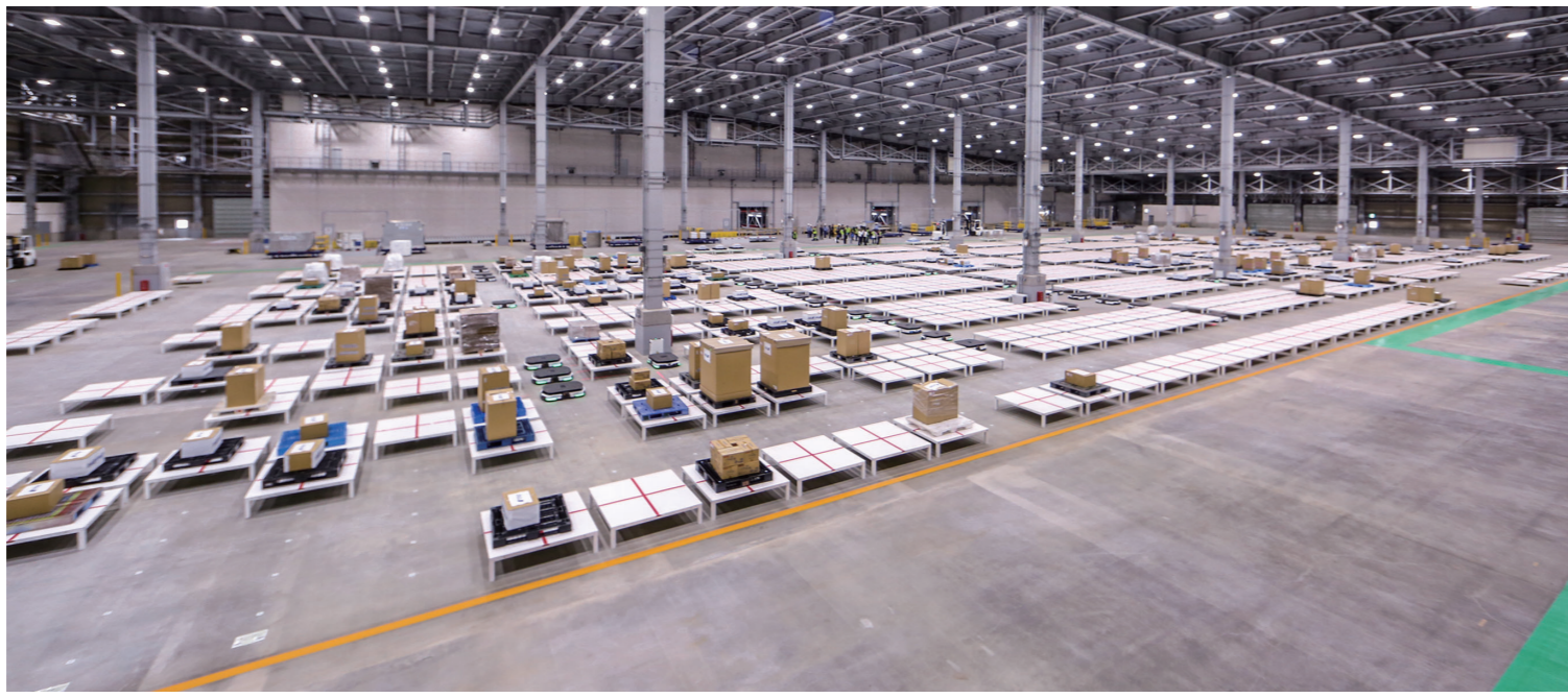
貨物の入出庫エリア