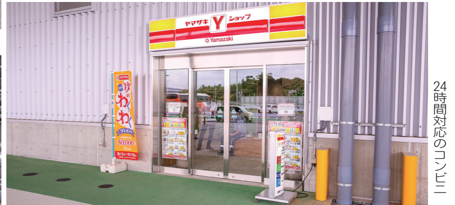
24時間対応のコンビニ