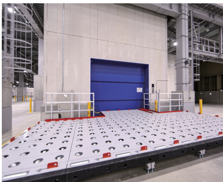
空ULD用エレベーター