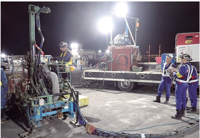
夜間に行われた地盤改良工事