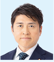
国土交通大臣 中野 洋昌