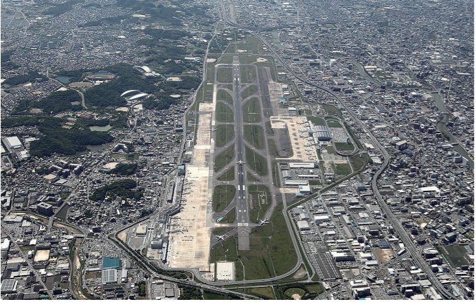
増設事業工事着手前(2016年3月)

12年度には国内線便の誘導路混雑による航空機の遅延や増設滑走路供用までの空港能力不足への対応として、国内線ターミナルビルの高さとなる管制塔新設工事などを行った。また、ヘリコプター施設は福岡市東区多地区へ移転し、滑走路一本による運用に備え空全体をその周辺を見渡せるよう、国際線地区側に国内線管制塔の高さとなる管制塔新設工事などを行った。