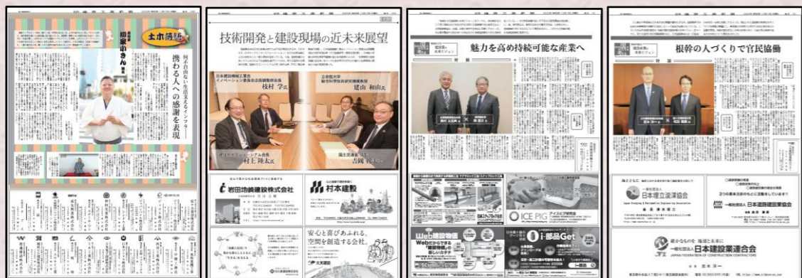
「日刊建設工業新聞創刊95周年特集 第1集」2023年10月16日付