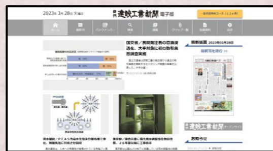
「日刊建設工業新聞 電子版」トップページ

会員登録制。いつでもどこでも日刊建設工業新聞を読むことが出来ます。紙面・記事ビューアーや紙面PDFデータのダウンロードをはじめ、充実したサービスを提供してまいります。